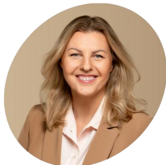
Donalda Meiželytė (vicemerė)